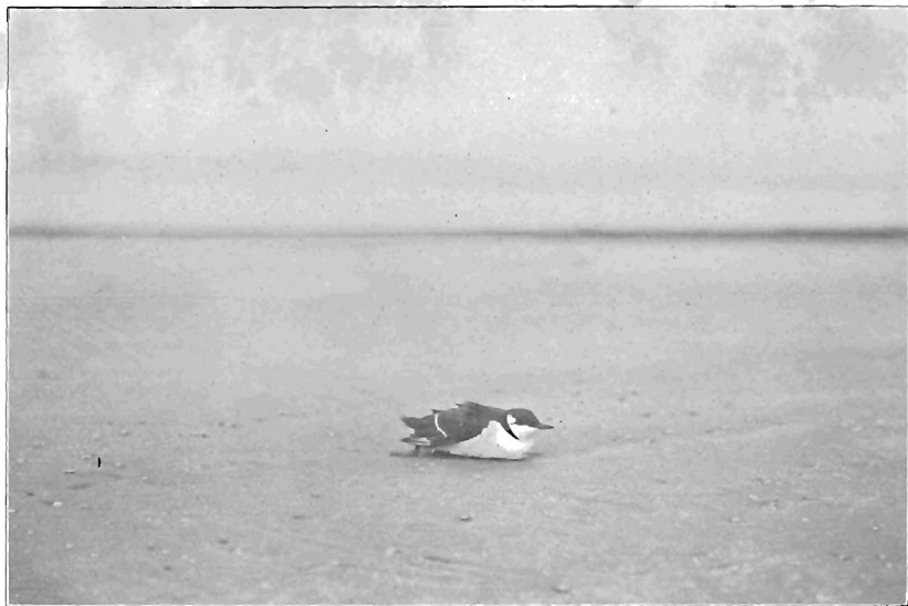
DE BEER : STERVENDE ZEEKOET