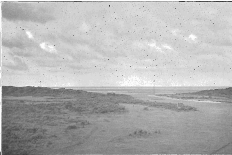
DE BEER : BAKENGAT