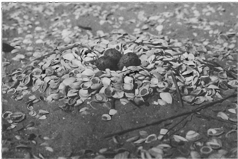
NEST VAN DEN KLUUT