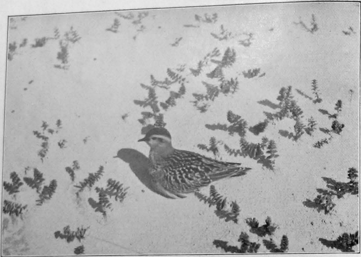
Morinelpluvier, Charadrius morinellus L.; „de Beer”, bij Hoek van Holland, 4 September 1931.