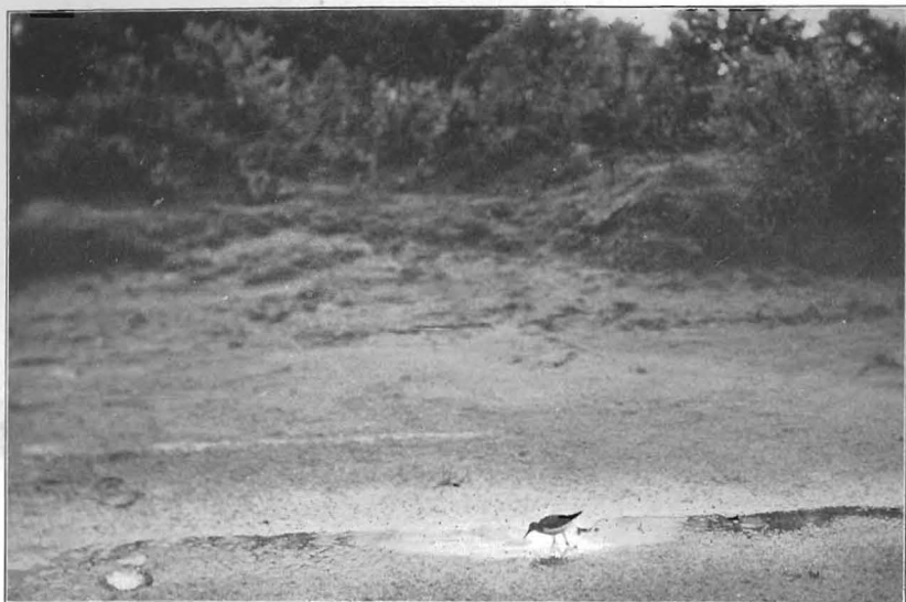
DE BEER : WITGATJE