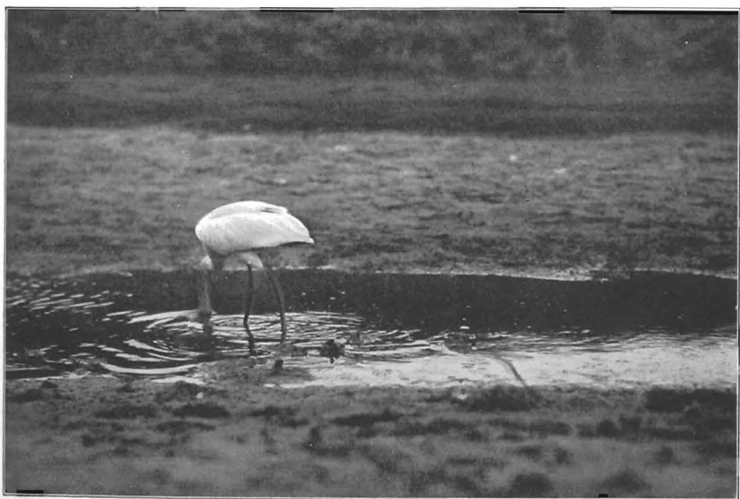
DE BEER : LEPELAAR