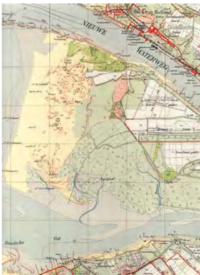
Figuur 1. Fragment topografische kaart 37 A, oorspronkelijke schaal 1 : 25.000, uitgave 1938. De naam Vogelplaat staat ten onrechte in het gors achter De Beer.

Voor een goed begrip volgt hier eerst een landschappelijke doorsnede van de Noordzee naar de Brielsche Maas. Naast de ondiepe Maasvlakte met de Robbenplaat lag een breed zandstrand dat deels begroeid was met zoutplanten (Fig. 5). Daarachter lagen lage en verwaaide, deels aangetaste duinen waar duidelijk geen beheer plaats vond en dat een zeer natuurlijke beeld vertoonde. Achter de grote zandhaak De Beer lag in een grote inham het