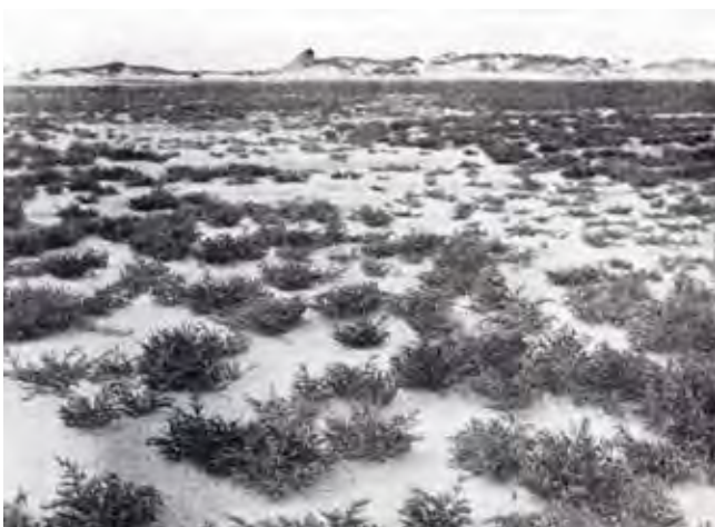
Figuur 5. Het Groene Strand met Schorrenkruid en op de achtergrond de verbrokkelde duinen, 1930.

zee waar nooit jutters kwamen. De fotografen vonden hier materiaal voor hun schuilhutten. De naam Bakengat is te vergelijken met het Sparregat in Meijendel: een paal in een duinopening. Op de topografische kaart uit 1938 staan aan de noordkant van De