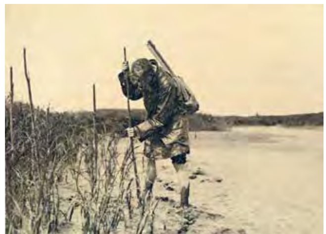
Figuur 6. Het maken van een schuilhut aan de rand van het Rietmoeras, ca. 1930.