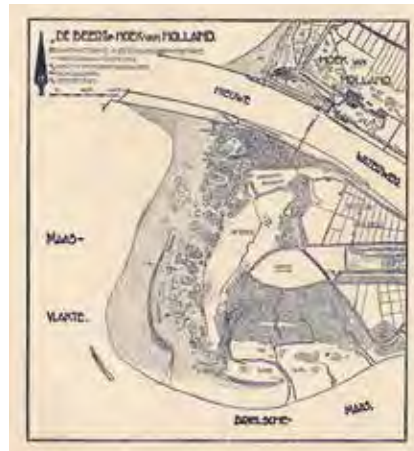
Figuur 4. Kaart uit Het vogeleiland 1930. Voor de moeilijk leesbare namen zie Tabel 1.