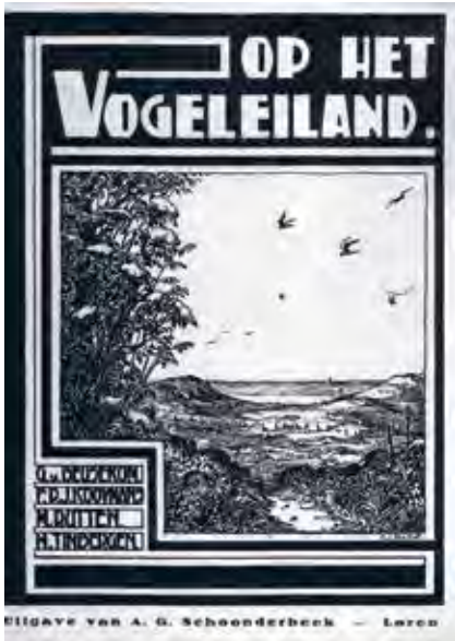
Figuur 3. Omslag boek Op het vogeleiland (op titelpagina Het vogeleiland ) 1930.