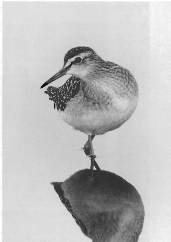
Schouwen is een ideaalgebied voor het fotograferen van allerlei steltlopers. Dat was alzo in de tijd van Vijverbergen Kooijmans. Ook Henk Harmsen maakte veel foto's van steltlopers op Schouwen-Duiveland. Deze Bosruiter fotografeerde hij bij Oosterland (Geule) op 9 september 1988.

Alleen al om zijn pionierswerk voor de vogelfotografie met alles wat daarmee samenhangt, ver-