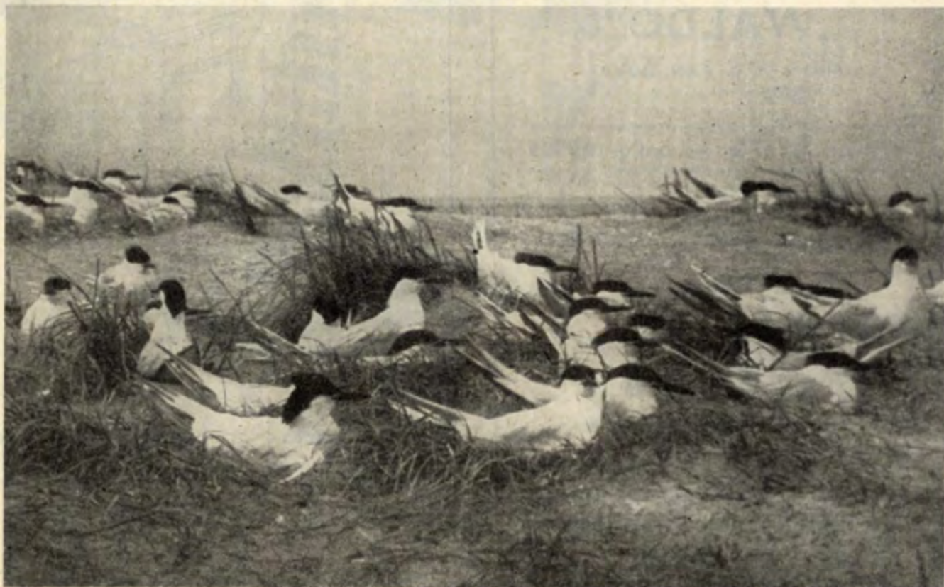
Grote sterns op de broedplaats

De fraaie bergeenden eindelijk maken hun nest heel gemoedelijk in een verlaten konijnenhol en als de jongen uitgekomen zijn, trekt de hele familie duin op duin af in de richting van de slikken in het Zuiden. A. DE JONG.