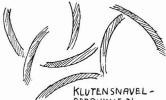
KLUTENSNAVEL- AFDRUKKEN IN HET SLIB