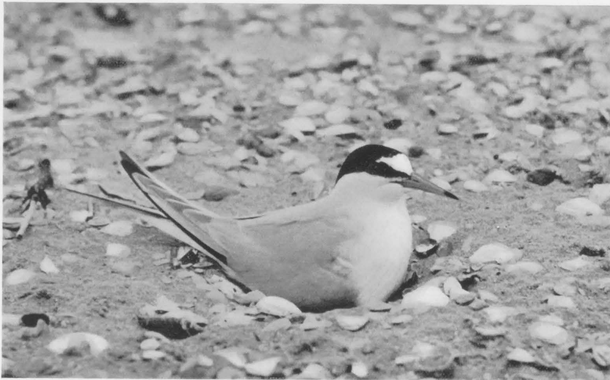
Het dwergsterntje nestelt bij voorkeur op de schelpvlakte