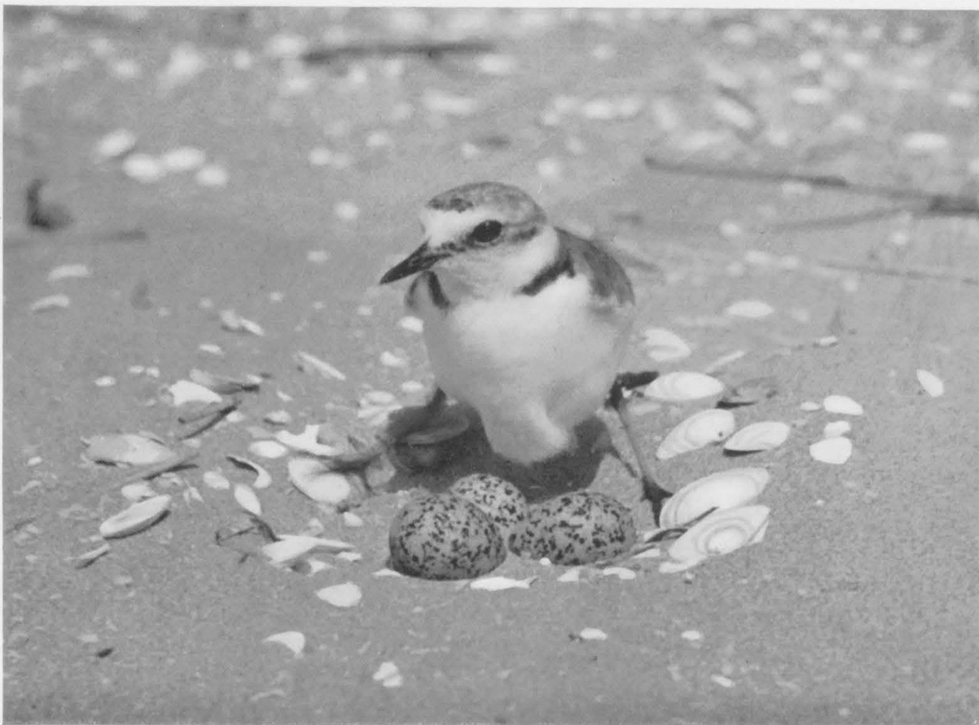
Strandplevier (mannetje) neemt plaats op de eieren

over de omgeving laten glijden. Dat doen we dan ook, en warempel, succes blijft niet uit! Eerst vinden we een nestje tussen het aanspoelsel en even later nog een tweede wat verder de vlakte op, middenin een dichte „mat” van rose-bloeiende melkkruidplantjes. Het zijn maar eenvoudige, met schelpjes en stukjes hout beklede kuiltes, maar de eieren zijn bijzonder mooi van vorm en kleur.