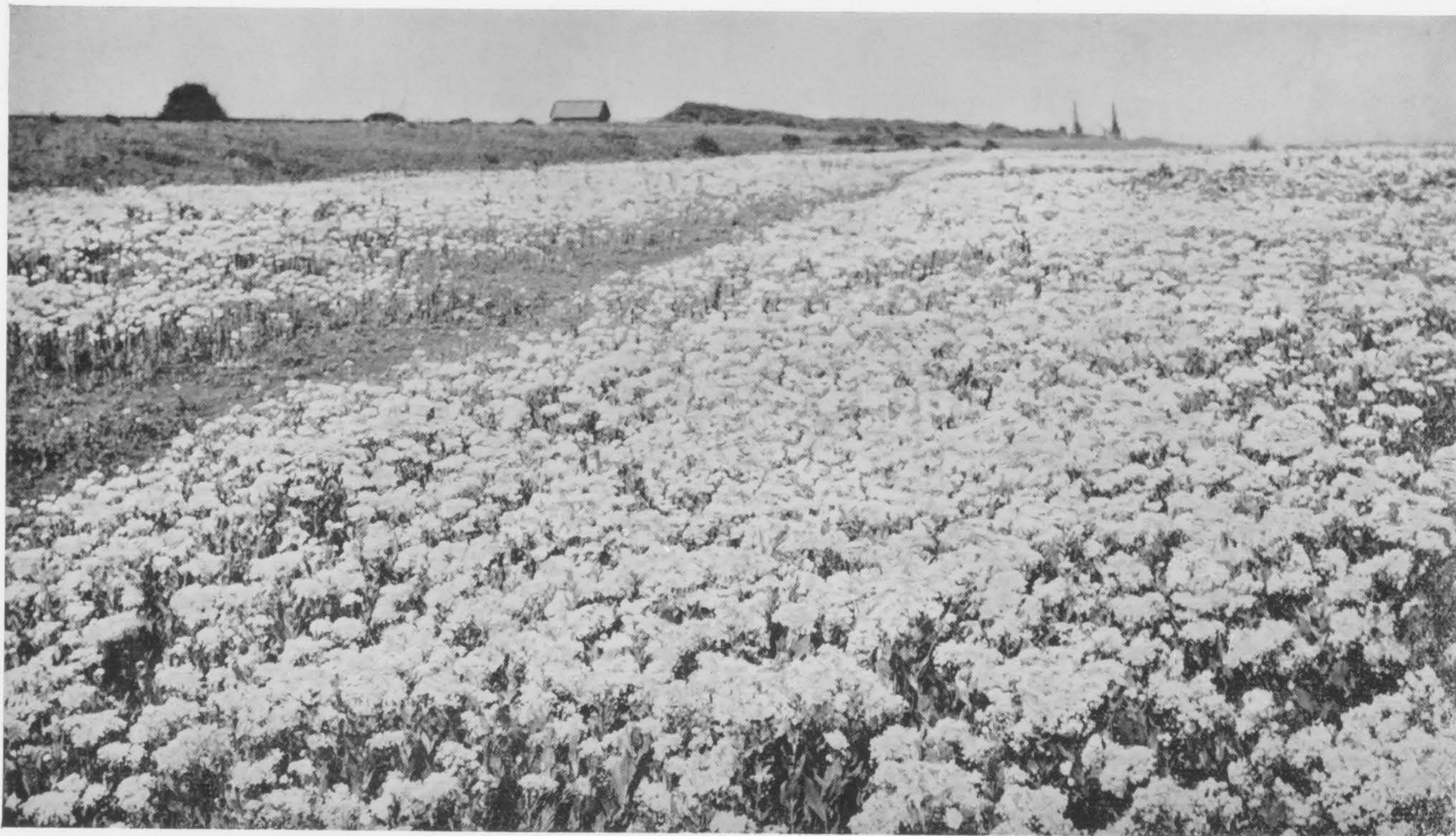
De vlakte met bloeiende pijlkruidkers

de aandacht trekken. Zoals de wulp bijvoorbeeld, die daar juist zo'n prachtige triller laat horen, of de bontbekplevieren met hun weemoedig gefluit. En hoe welluidend klinkt ook de roep van de kluten, waarvan er ginds verscheidene op hun lange, blauwgrijze poten door de plassen waden. Het luidruchtigst zijn de scholeksters, hun snerpend „tepiét-tepiét” horen we telkens boven alles uit. Heel wat van deze druktemakers kuieren er rond; met driftige bewegingen boren ze hun snavel in de modder, op jacht naar wormen en schaaldiertjes. Ook zien we er langs de vloedlijn scharrelen, waar ze tussen het aanspoelsel naar mosselen zoeken; met hun plat uitlopende snavel weten zij de schelpen gemakkelijk te openen.