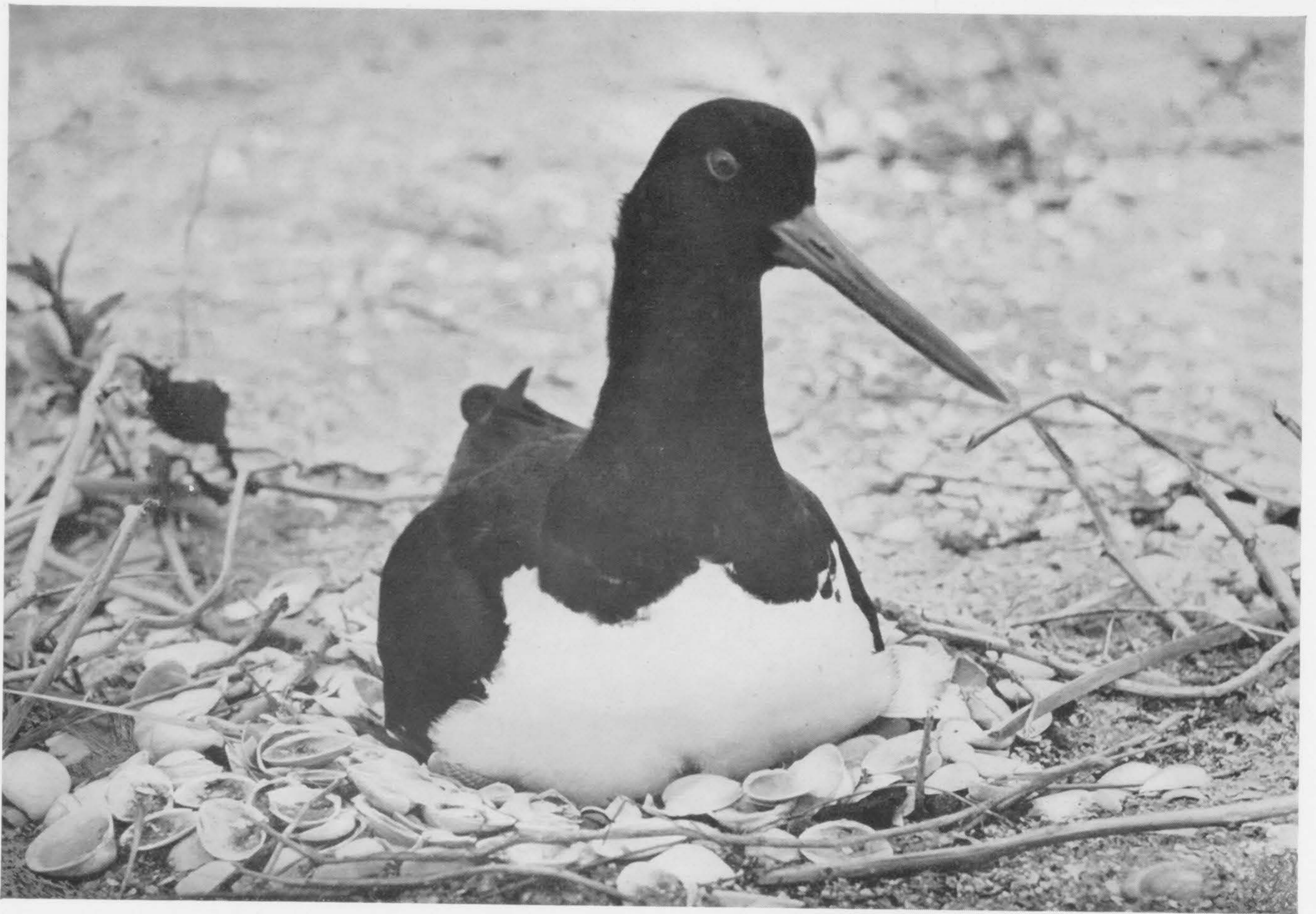
Bonte Piet, een lastige deugniet

Typisch is, dat die visdiefseieren zo in kleur en tekening uiteenlopen, soms zelfs de exemplaren van hetzelfde legsel; de meeste zijn donkergevekt op bruin-grijze ondergrond, maar we vinden ook groene en lichtblauwe eieren. De laatste zijn wel het mooist.