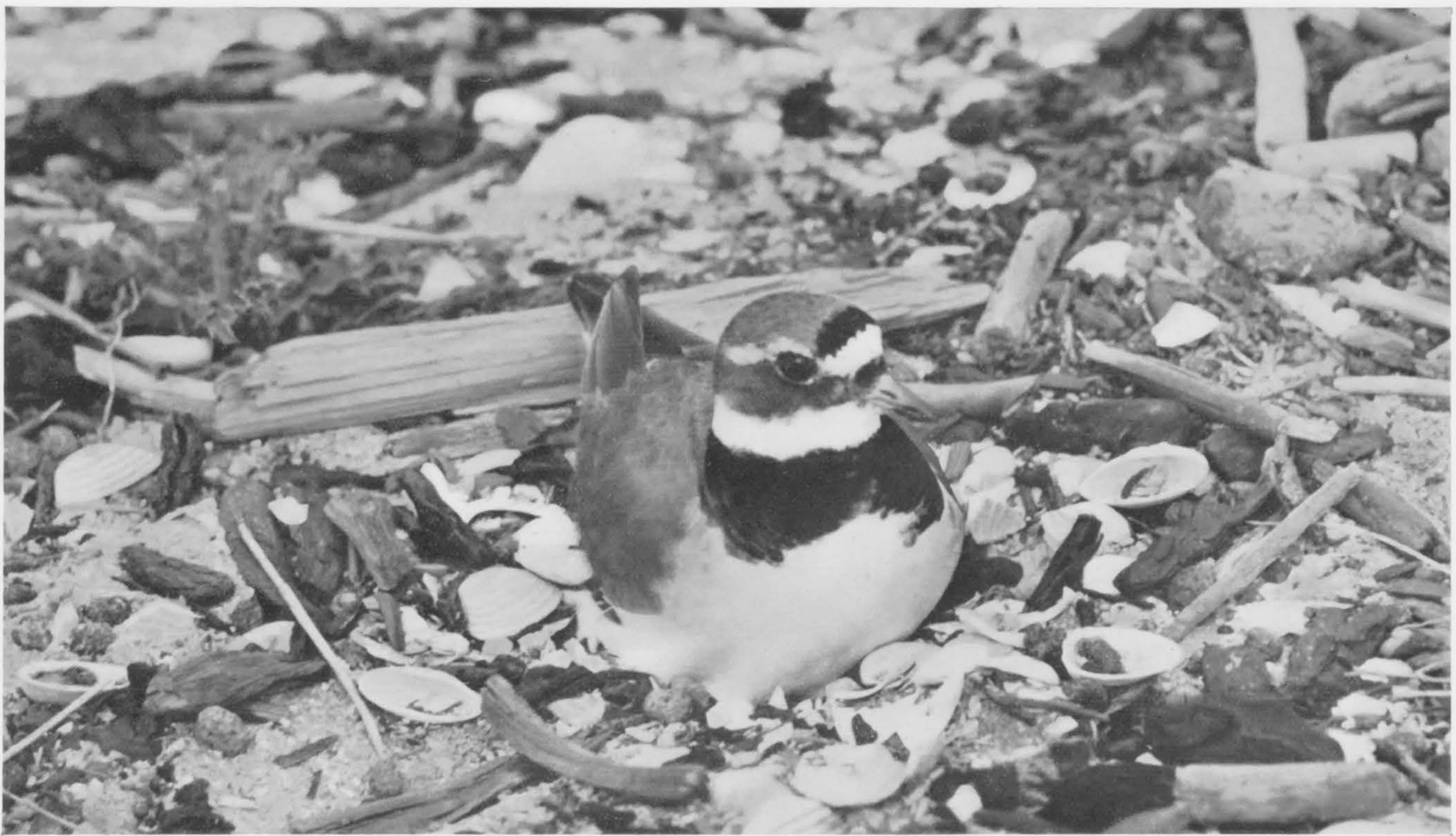
Bontbekplevier op zijn nest tussen aangespoelde rommel

komen de verontruste vogels boven ons kringen.