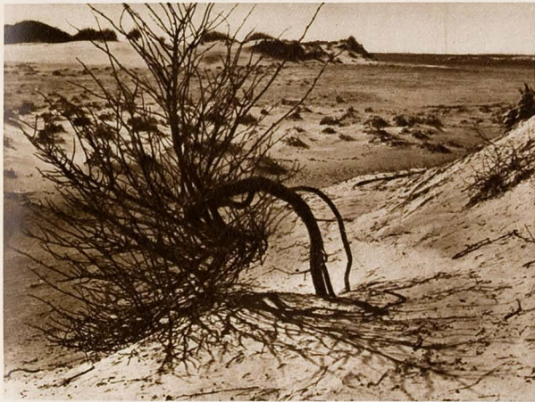
Boven: Verwongen en gekromd onder het geweld van de stormen, worstelde een vlier om haar bestaan.

Wij naderden langzamerhand het uitgestrekte moeras aan den mond van de Brielsche Maas. Grillige krekens slingerden er zich door heen; hier de oevers ondergravend, wat verder een steeds hooger wordende sliblaag vormend. Ieder jaar wisselend en ongebreideld nieuwe geulen schurend. Een groote troep grauwe ganzen ging gakkend de lucht in en nu viel ons ook de imposante verschijning op, waarvoor wij onzen tocht eigenlijk ondernomen hadden. Met forse slagen van z'n machtige wieken vloog de zeearend over het moeras. Pijl-