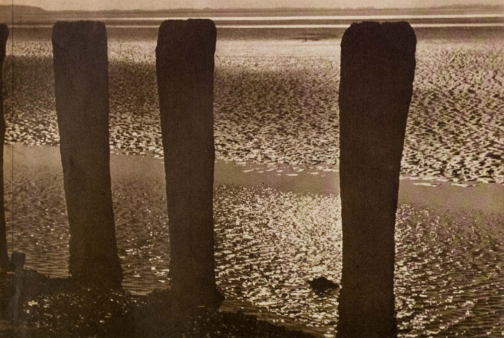
Het zonlicht fonkelde over het drooggevalen land.

staarteenden, smienten en talingen wervelden in wilden angst van de gladde slikplaten om ver weg een veilig heenkomen te zoeken. Maar de zeearend had andere plannen en wiekte voort, alsof deze opwinding hem niets aanging.