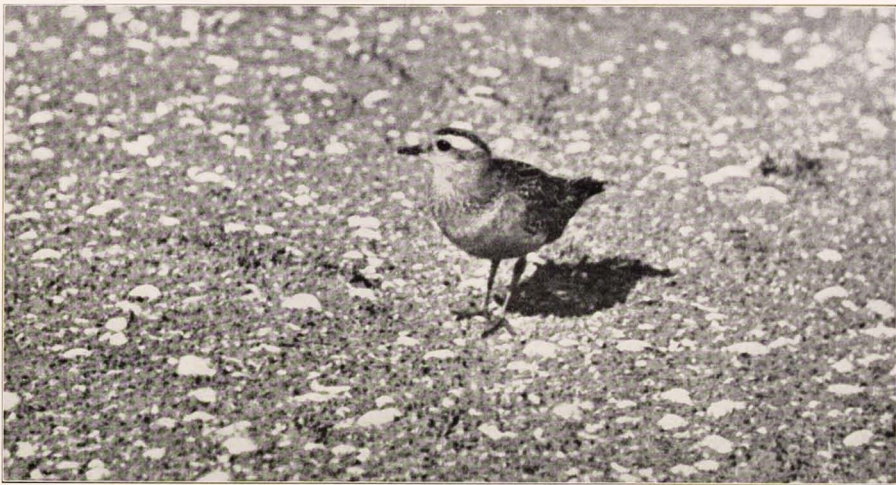
Nog een foto van één van de vijf morinellen, waar we de hele dag achteraan wandelden

later weer die beide vreemde mensen op bezoek kregen.