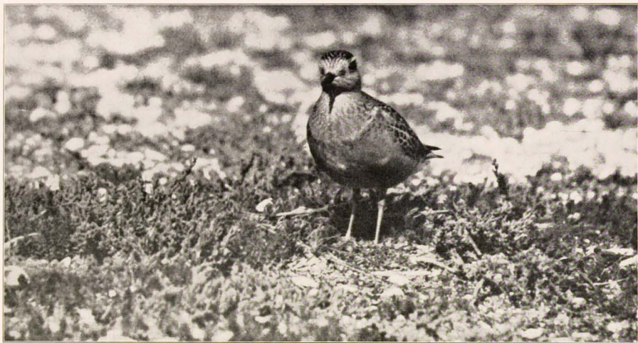
Heel mooi bleef hij even staan, het hoofd een beetje scheef . . . .

er al herhaalde malen in geslaagd de vogel van vlakbij, zonder enige schuilhut of zo, te kicken en dat wilden mijn vriend en ik nu ook eens proberen.