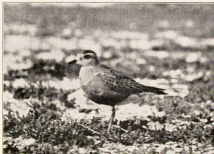
Morinelplevier in winterkleed

van onze vrienden, hoewel ik moet toegeven, dat het niet van harte ging. Maar het was trouwens al vier uur geworden en om half vijf moesten we met de veerboot mee. We hebben de morinellen een gelukkige en voorspoedige reis naar Noord-Afrika