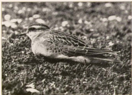
... gingen de vogels weer op de grond zitten, waar we ze tot op minder dan één meter konden naderen