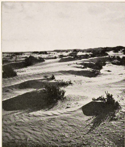
Schaduwspel op „De Beer“ (Fotowedstrijd)

we weer over schelpenstrand kwamen en direct waren de dwergsterns luid alarmerend boven onze hoofden, terwijl enkele kluten ook al weer zenuwachtig werden. Maar inmiddels was 't vrij hard gaan waaien en dat bracht hier wolken stuifzand mee, zodat we dit terrein vermeden hebben, door er met een boog omheen te gaan, want door ons toedoen zouden anders de ouden te lang van hun nesten of jongen verwijderd zijn, wat met dat waaiende zand wel eens noodlottig kon zijn. Van een flinke, veilige afstand konden we de vogels door onze kijkers dicht bij ons halen. Verder hadden we het gezicht op de Brielse Maas, waar, nu het langzamerhand laag water werd, ook al een menigte vogels aanwezig was. Behalve flink veel bergeenden en wilde eenden zagen we ook enkele steltlopers, gasten, die in het hoge Noorden thuis horen, als rosse grutto, zilverplevier in zomerkleed, terwijl De Jager ook steenlopers meende te zien, maar die waren zover weg, dat ik daaromtrent geen zekerheid had, te meer daar we tegen de zon in moesten waarnemen, wat altijd een stuk lastiger is.