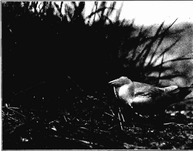
Nummer 2 „voor den bakker”

Na twee uur wachten zei Teun korzelig: „Dat heb ik nou al 'n paar keer gehad, na één uur ver-