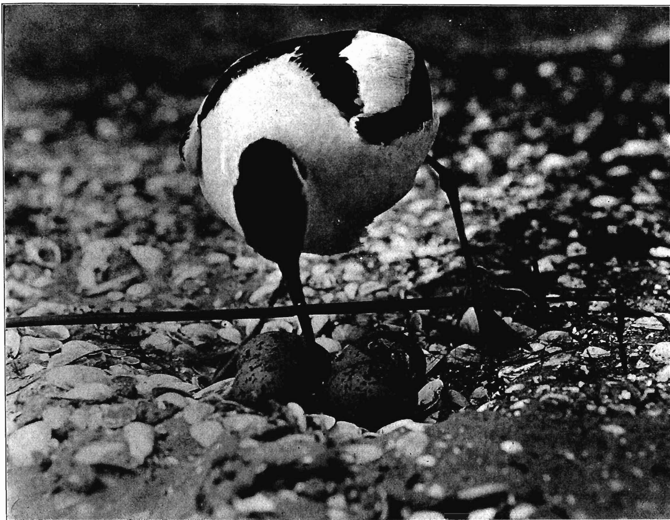
De groote onbekende