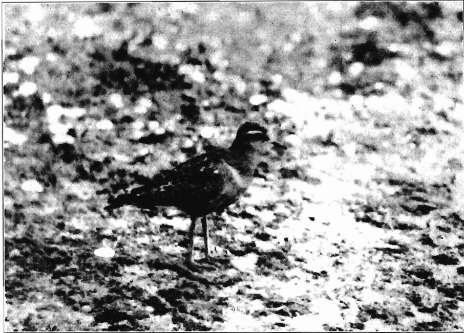
Morinelleplover in winterkleed op het begroeide strand van de Beer September 1929